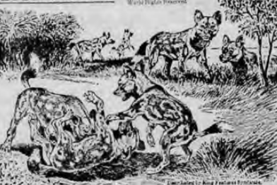
LOS PERROS SALVAJES, COMO TODOS LOS CANES, JUEGAN ENTRE SI... SOBRE TODOS LOS CACHORROS...