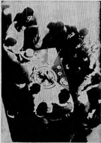
MONTEVIDEO, Noviembre 27 — AP.— Día de elecciones en Uruguay, y también día de Juega en la capital, Montevideo, donde la ley prohíbe arrestos por delitos menores en día de elecciones. El juego ilegal es delito menor, así que se ven ruletas portátiles como ésta en la arteria principal, de Montevideo, Avenida 18 de Julio. 1966.

NACIONES UNIDAS, 28. AP.— Una moción instando a que una proyectada conferencia mundial de desarme considere seriamente prohibir el uso de las armas nucleares fue aprobada hoy por un comité de las Naciones Unidas.