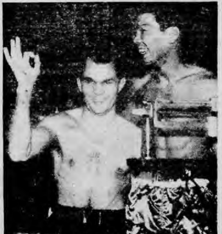
NEUVA YORK Noviembre 28 —AP— El campeón de peso lliverto, Carlos Ortiz de la señal de aprobación y el relator Flash Etorde sonríen hoy en la ceremonia del peso en las Oficinas de la Comisión Atlética del Estado de Nueva York por su peña por el título de la noche en el Madison Square Garden. Ortiz dio exactamente el peso límite de la división y Etorde, que es campeón de peso ligero junior media 1/2 libra menos que Ortiz. 1966