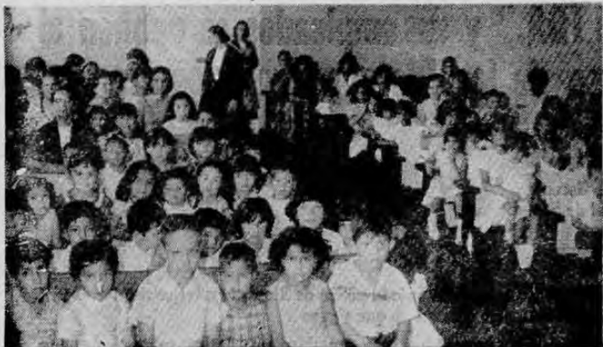
Distinguidas damas de la colonia cubana agasajaron a numerosos niños pobres de Calle Blancos, San Francisco de Guadalupe, quienes recibieron anticipadamente el aguinaldo del Dios Niño. Fue una reunión en extremo alegre, llena de