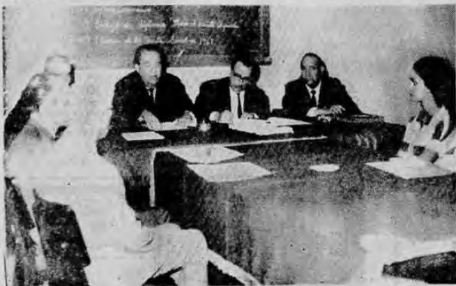
20 ANIVERSARIO DE CAMARA DE AGRICULTURA — Ayer celebró la Cámara de Agricultura sus 20 años de haber sido constituida y trabajar en beneficio de esta actividad laboral. Con ese motivo se leyeron los informes de fin de labores de la

mas de desarrollo dictadas por el Banco Central, en nada contribuirán a fortalecer al país, ya que actualmente los bancos están obligados a colocar los recursos apegados a los dictados de política monetaria emanados del Instituto Emisor. La única diferencia existiría en que los bancos nacionales en la actualidad operan con un espíritu de servicio público, en cambio los bancos privados extranjeros tratan siempre de multiplicar sus utilidades, para evitar el mayor monto posible de beneficios al extranjero, después de haber explotado nuestros propios recursos nacionales destinados a estimular lo frente con éxito su crecimiento. Se agregó en el proyecto de ley que los bancos comerciales extranjeros traerán al país la suma de $ 40.000.000,00 de capital, lo que contribuirá al desarrollo del país. Esta afirmación es ridícula ya que, esta suma resulta insignificante en comparación al monto actual de recursos del Sistema Bancario $ 1.400.000.000,00. Por otro lado se señaló que en la actualidad el sistema bancario está tramitando la suma de $ 90,3 millones de dólares, en el extranjero para operaciones de verdadero desarrollo, además de los $ 30 millones adicionales que el Banco Central pone a circular en el último trimestre del presente año y los $ 42 millones en línea de crédito con el extranjero que para este mismo período del año ha autorizado el Instituto Emisor.