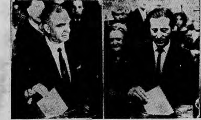
MONTEVIDEO, 28 — — El General Oscar Daniel Gessido (a la izquierda) candidato del Partido Colorado electo el domingo como Presidente de Uruguay, en el momento que depositaba su voto. A la derecha Zelmar Michelini vota, mien

Soviética y China Comunista. Se abstuvieron México, Chile y Ecuador.