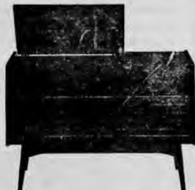
Radiofonógrafo "NATIONAL" Bellísimo, acabado en fórmica. Cambiador de discos automático, radio con frecuencia modulada. Navidades Felices con un "RADIOFONOGRÁFO NATIONAL"