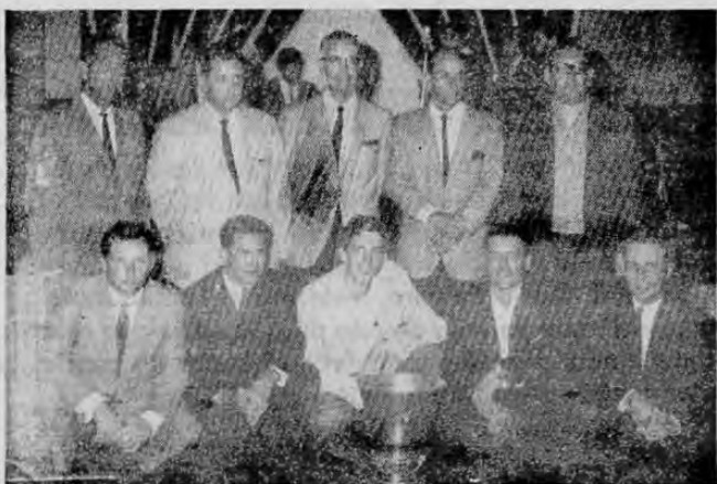
He aquí a los integrantes de la selección golfística nacional que conquistó con todos los honores el Campeonato Centroamericano en el brillante torneo llevado a cabo durante cuatro días en los links del Costa Rica Country Club, por medio de la hermosa copa rotativa que se pone en juego cada dos años.

Redactor Jefe: LUIS CARTIN PANIAGUA — Redactor: LUIS ALBERTO GARCIA A.