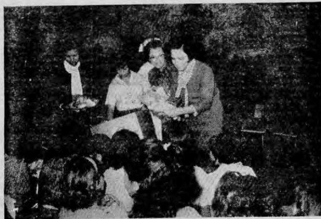
El U. S. Government Wives Organization donó en días pasados a la Casa del Buen Pastor en Guadalupe, un lote de zapatos para las niñas que forman parte de este plantel. En la gráfica aparece la

En dicho bazar se venderán objetos de los que