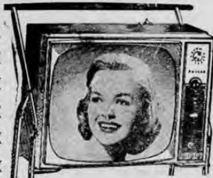
Televisor "PHILCO" Modelo 3554, pantalla de 19"; imagen perfecta, sonido de alta calidad. Instalado con antena y mesita americana.