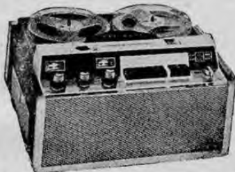
Grabadoras "NATIONAL" En todos los modelos y para todos los precios. Hay una grabadora "NATIONAL" para todos los gustos y presupuestos.